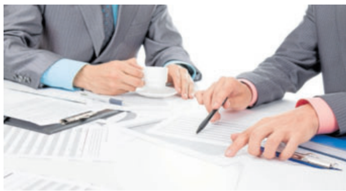
NA MOŽNOST daňového odečtu je u životního pojištění nutné myslet předem.

Nesmí tedy umožňovat průběžné mimořádné výběry, musí být sjednána minimálně na pět let a minimálně do 60 let věku pojistníka. K tomu je nezbytné, aby sjednaná pojistná částka na pojištění pro případ smrti byla alespoň 40 tisíc korun (smlouva do patnácti let trvání), respektive 70 tisíc ko-