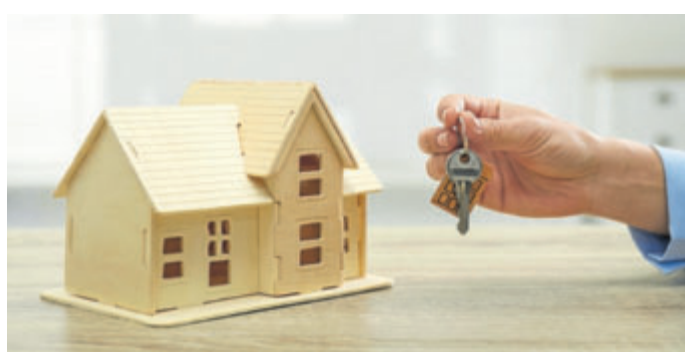
ODEČTĚTE SI ÚROKY. Stát podporuje zlepšování podmínek bydlení i touto specifickou formou.

Mezi další odečitatelné položky od základu daně patří životní a penzijní pojištění, dary, darování krve, odborářské členské příspěvky a platby za zkoušky, které potvrzují výsledky dalšího vzdělávání. (jg)