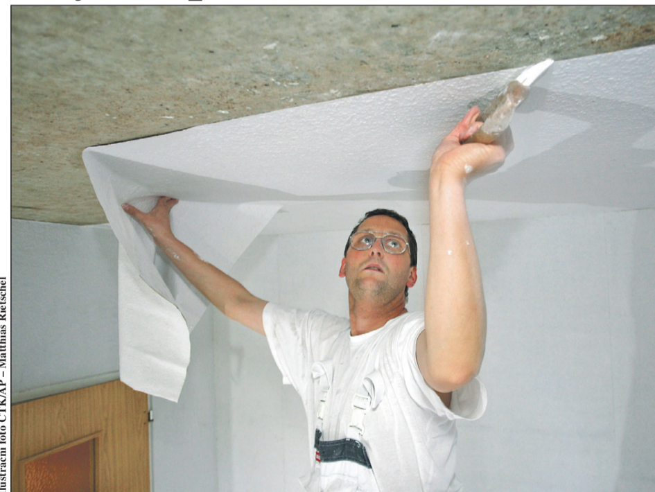
Ilustrace foto ČTK/AP - Matthias Rietschel

Mnozí řemeslníci podle ní uvádějí, že zaznamenávají ještě vyšší poptávku než před pandemií a mají na řadu měsíce dopředu plno. „Zvýšená poptávka umožňuje i zvýšení cen za prá-