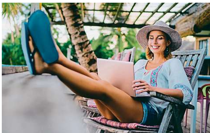
V práci jako na dovolené. Šéf má vždy vědět, odkud pracujete.

A zatímco si v přímořské vilce svých přátel užíval, plnohodnotný home office, odkud bez problémů pracuje už několik týdnů, jiné firmy zaměstnancům práci ze zahraničí zcela zapověděly. „Na