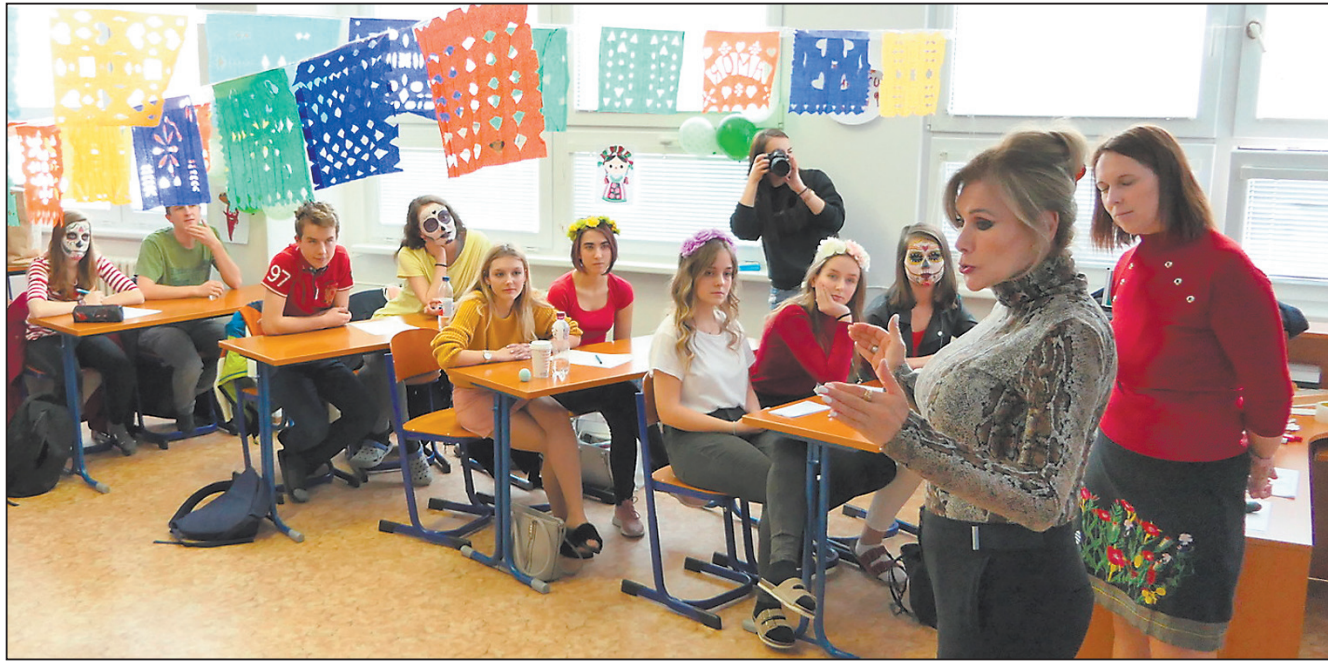
Její Excellence, velvyslankyně Mexika Eleonora Ruedo, je jednou z osobností, které chtějí studenti zapojit do tvorby videí k propagaci kuchařského umění a řemesla. Na snímku je při besedě s jihlavskými studenty v lednu 2019.

Vyhodnocení je plánováno na březen, slavnostní vyhlášení oceněných se má konat 15. dubna. Střední školy se zapojují