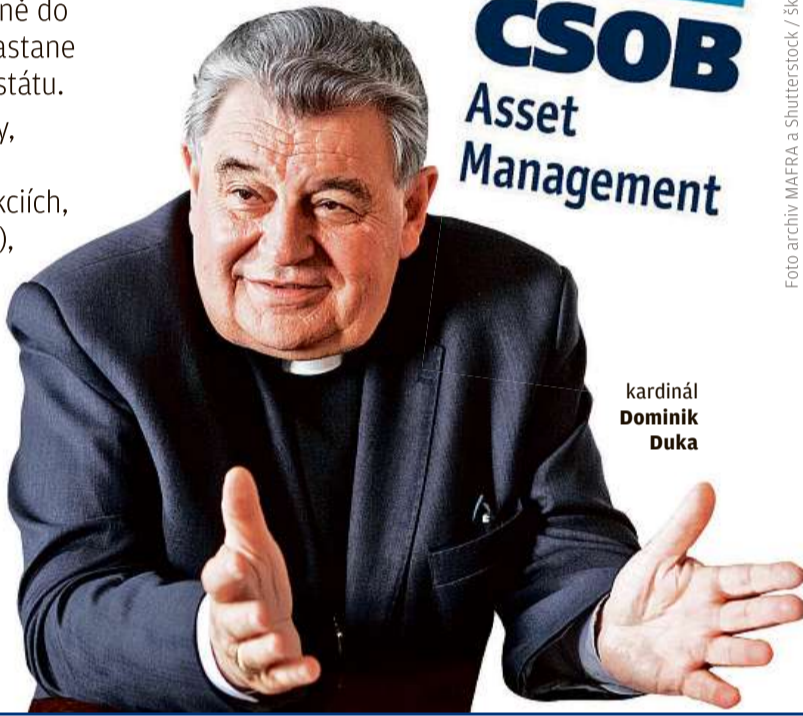
kardinál Dominik Duka