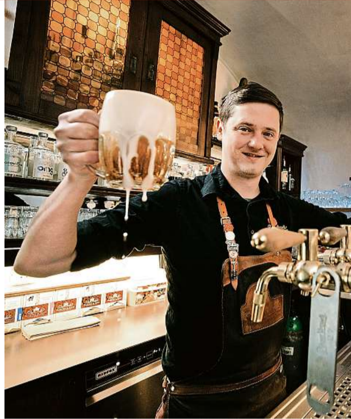
Nápady Odborníci tvrdí, že řada restaurací bude muset změnit strategii, pokud budou chtít přežít.