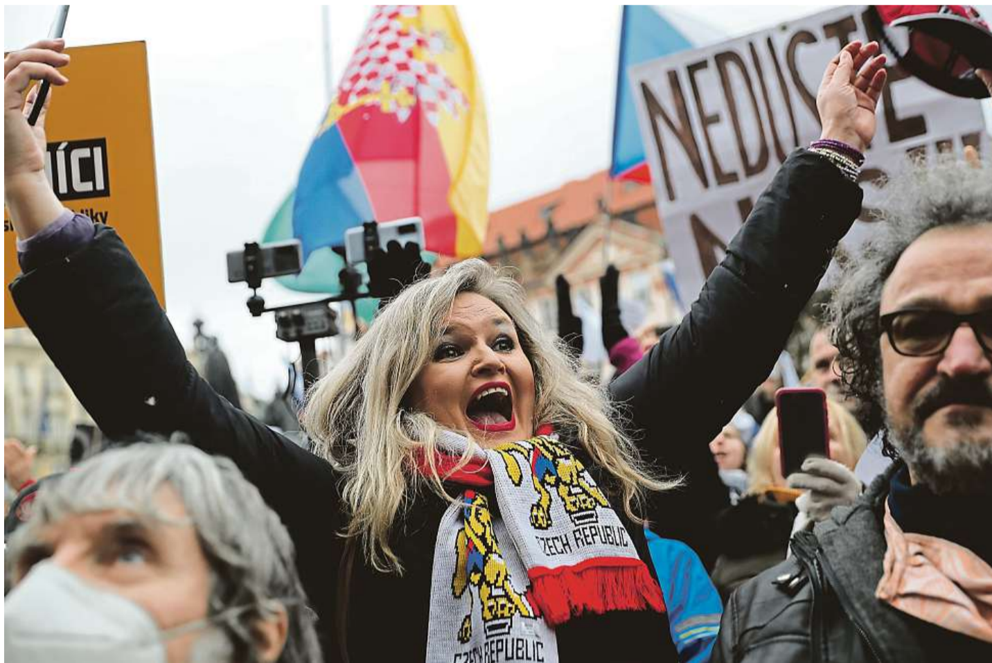
Protest bez obav z nákazy Velká část demonstrantů, kteří včera zaplnili Staroměstské náměstí, byla v davu účastníků bez roušek. Protest svolala iniciativa Chcipl PES, která usiluje o rychlé otevření restaurací a dalších podnikatelských provozů a o lepší kompenzace živnostníků.