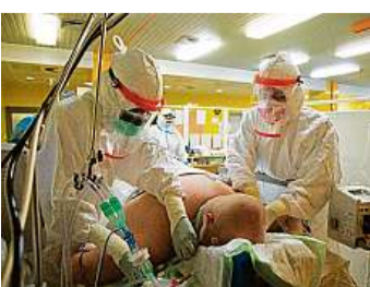
Bulovka V libeňské nemocnici se v těchto dnech bojuje o životy pacientů s covidem-19.

Severní část by zůstala státu, přičemž se zvažuje propojení nynějších oddělených pavilonů nemocnice do jedné budovy. Město by pak jižní část využilo pro svoje účely.