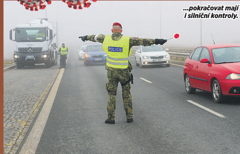
...pokračovat mají i silniční kontroly.

Nouzový stav, tedy státní krizové opatření, je jedním ze symbolů současné pandemie nemoci covid-19. Opakované jej vyhlásila vláda, která ho označuje za nutnost pro přijímaná opatření v boji proti šíření nákazy. Nouzový stav byl v ČR v souvislosti s koronavirem poprvé vyhlášen 12. března 2020. Mnohokrát se stal předmětem politického boje ve Sněmovně. Kvůli covidu-19 byl dosud v ČR vyhlášen celkově na 241 dnů. Nyní trvá nepřetržitě od 5. října, tedy už 161 dní.