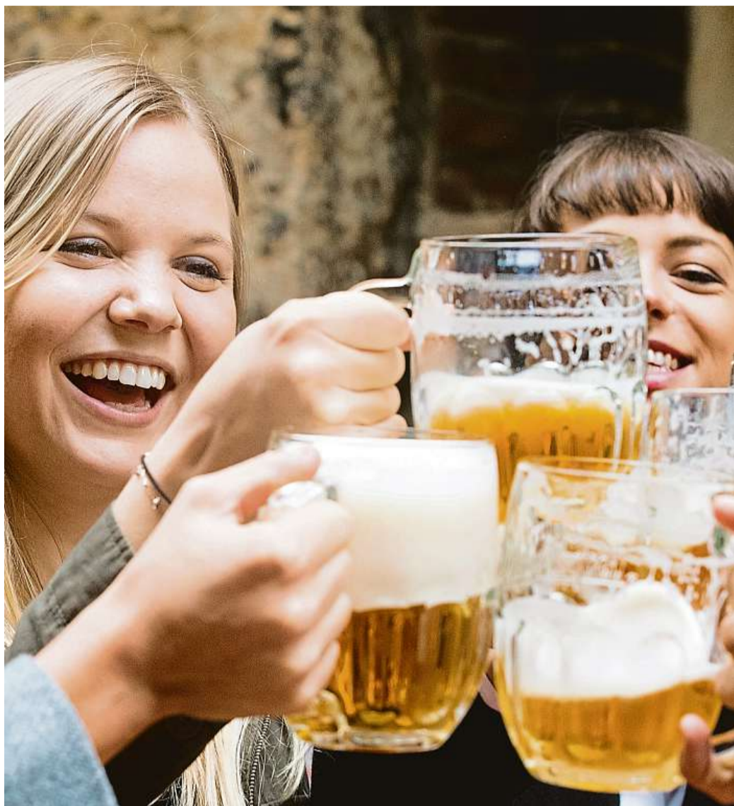
České hospody se uzavřely právě před rokem. Na pamětním snímku z doby předkoronavirové jsou hosté restaurace U Pinkasů - nejstarší pilsenské restaurace v Praze.

„Podíl 35 procent z roku 2019 se už nikdy nevrátí. Zůstane ko-