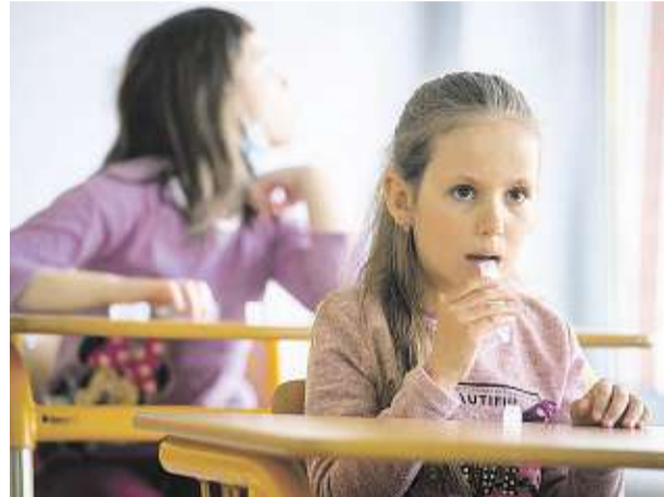
Hrozí, že testy na covid budou ve školách chybět.