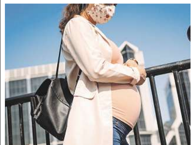
U těhotných je opatrný přístup k očkování.