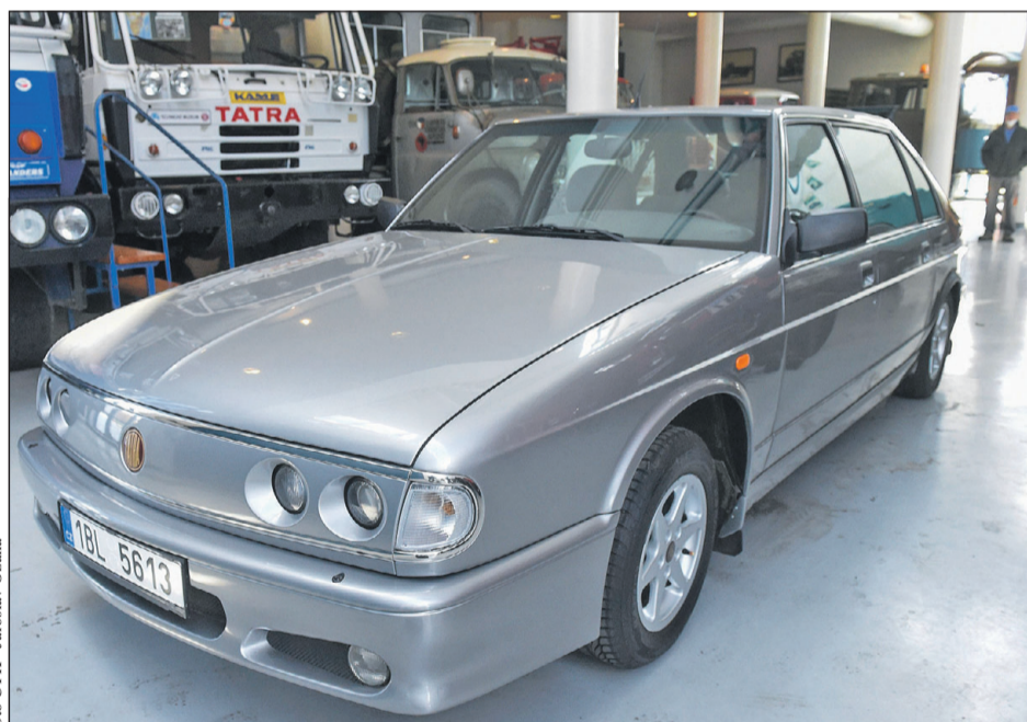
POSLEDNÍ LIMUZÍNA. Před 25 lety, 9. dubna 1996, představila jedna z nejstarších automobilek světa Tatra svou novou limuzínu Tatra 700. Na trhu luxusních aut se však prosadit nedokázala. Z výrobních linek sjelo jen pár desítek těchto vozů, a tak dnes mezi motoristickými nadšenci platí za cenný sběratelský kousek. S ukončením výroby modelu 700 v roce 1999 se zároveň uzavřela více než stoletá historie produkce osobních automobilů kopřivnické značky.

LG byla ještě před osmi lety třetím největším prodejcem mobilů na světě. (rei)