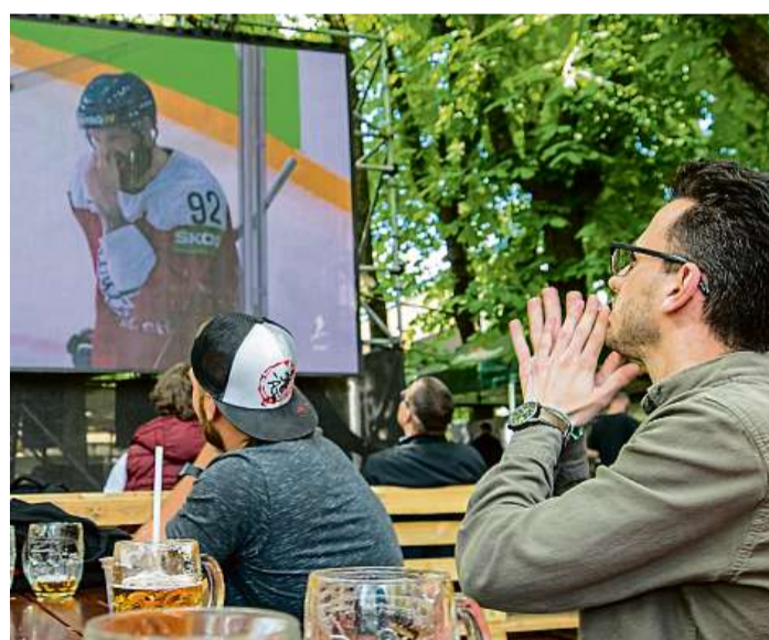
Riegrový sady. V zahradní restauraci na pražských Vinohradech lidé sledovali hokejové mistrovství. Budou moci přijít i na fotbal?