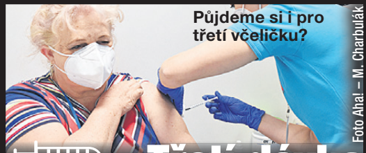
Půjdeme si i pro třetí včeličku?