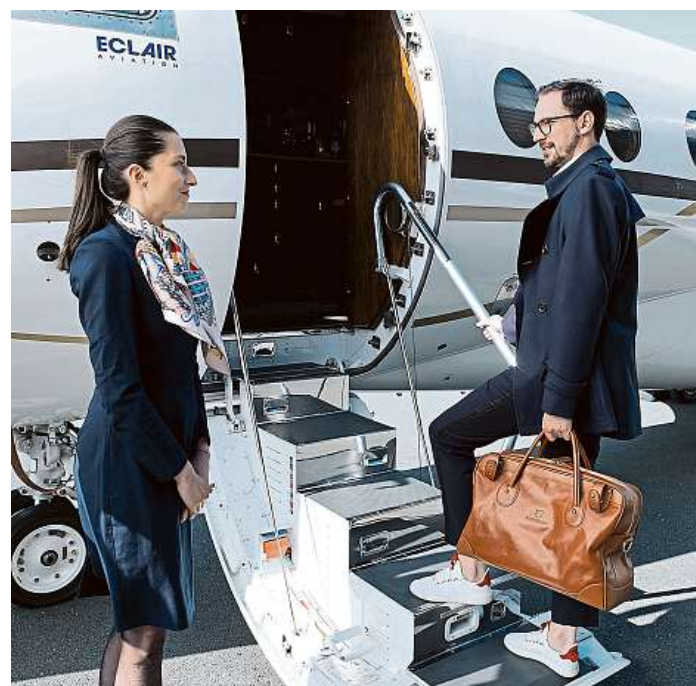
Vzkvétající byznys. Privátnímu letectví pandemie prospěla.

Obecně letectví přitom kvůli pandemii koronaviru zažilo jedno z vůbec nejtěžších období v historii. Výjimkou kromě privátního létání byly už jen nákladní lety, kterým se dařilo díky vzkvétajícímu nakupování přes internet. Během letní sezony se sice do vzduchu vrátila část cestujících, je však pravděpodobné, že se s podzimem krušné období částečně vrátí. To bude znamenat další příležitost pro provozovatele soukromých tryskáčů.