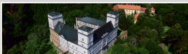
Zastavovaný areál zámku Račice s pozemky 50 000 m 2 .

Portfolio investic najdete na adrese www.e-finance.eu .