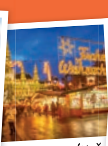
Vánoční trh - Vídeň