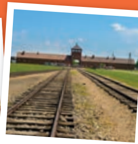
Osvětím - Polsko