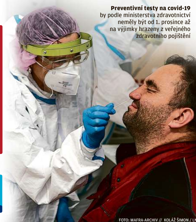
Preventivní testy na covid-19 by podle ministerstva zdravotnictví neměly být od 1. prosince až na výjimky hrazeny z veřejného zdravotního pojištění