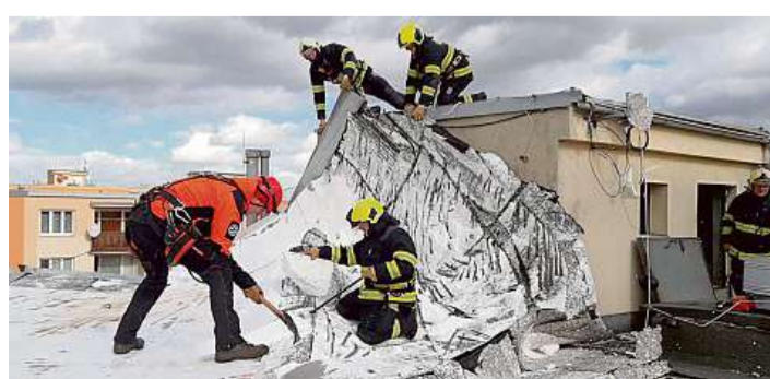
Vichřice Smršť, která se ve čtvrtek prohnala velkou částí republiky, poškodila elektrické vedení, střechy a zaparkovaná auta.

Generali České pojišťovně během čtvrtečního odpoledne klienti nahlásili 460 škod způsobených