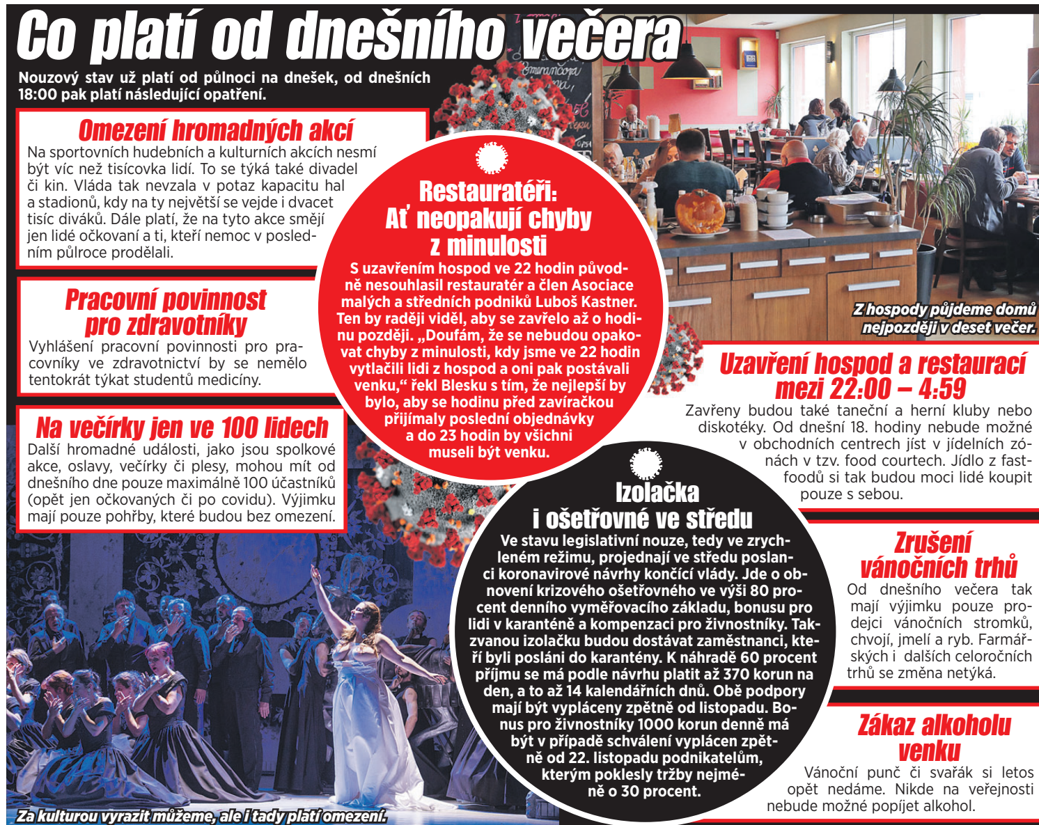
Za kulturou vyrazit můžeme, ale i tady platí omezení.

Vánoční punč či svařák si letos opět nedáme. Nikde na veřejnosti nebude možné popíjet alkohol.