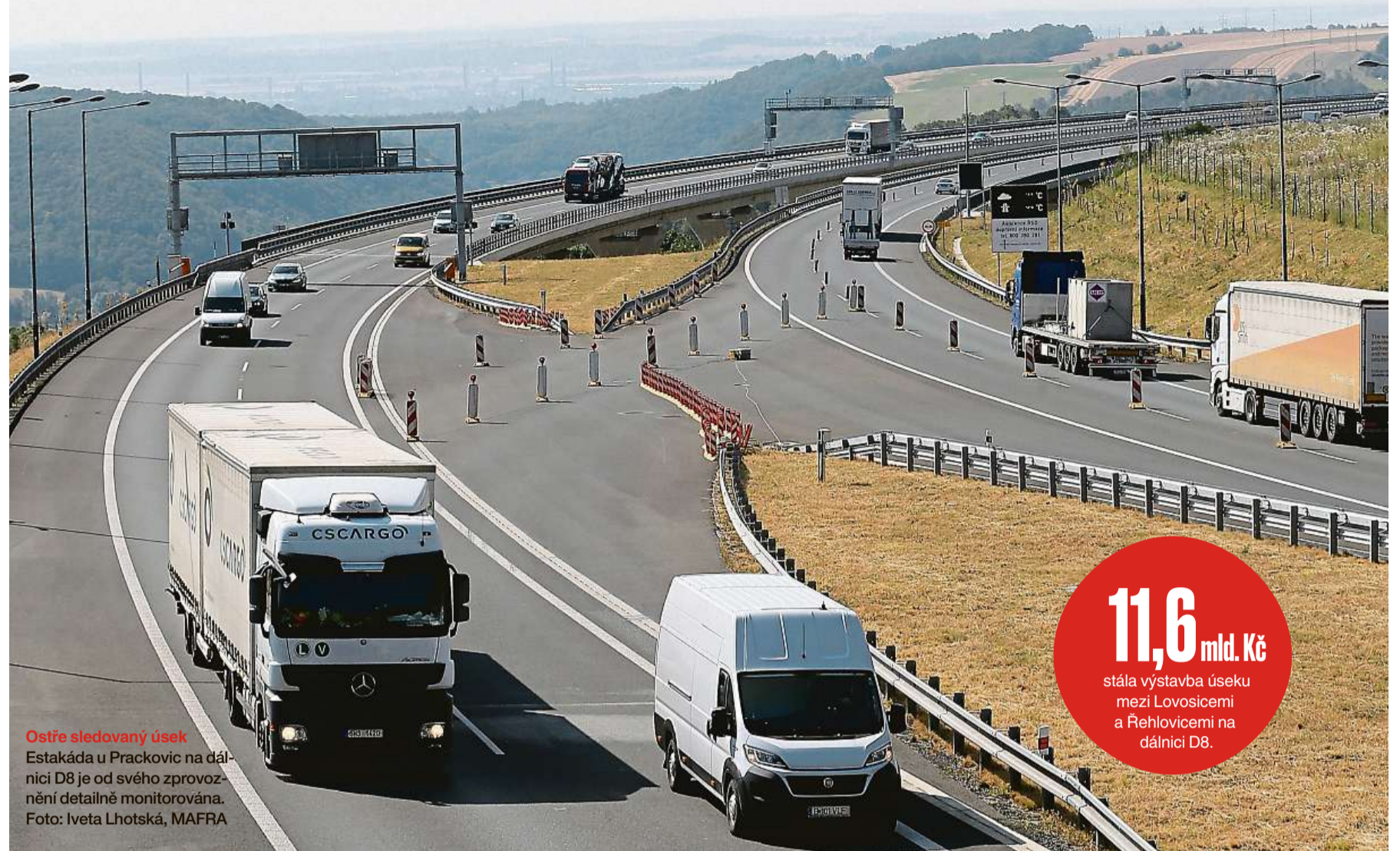
Ostře sledovaný úsek Estakáda u Prackovic na dálnici D8 je od svého zprovoznění detailně monitorována.

Češi plánují utratit za Vánoce v průměru 12 700 korun. Z toho za dárky chtějí utratit zhruba osm tisíc korun, za jídlo kolem 3 400 Kč a za vánoční výzdobu 1 200 korun. Zároveň si desetina Čechů plánuje na dárky půjčit, v průměru 10 600 korun, i když 95 procent lidí si myslí, že půjčka na vánoční dárky není obecně dobrý nápad. Vyplyvá to z průzkumu České bankovní asociace, který provedla agentura Ipsos mezi tisícovkou respondentů. Nejčastěji si na úvěr o Vánocích lidé chtějí pořídit spotřební elektroniku, a to v 57 procentech případů. (ČTK)