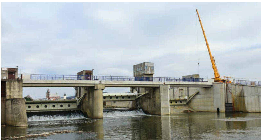
Jez už je osazený novými vraty.

Rozšíření hranického jezu na tři pole finišuje. Jez je osazený novými technologiemi, v současnosti jsou již všechny hlavní stavební práce dokončeny a probíhají závěrečné práce na technologiích i elektroinstalacích a podkladních vrstvách obslužných komunikací. Vše spěje k dokončení rekonstrukce a předání díla v průběhu prosince, kdy bylo naplánováno uvedení jezu do provozu.