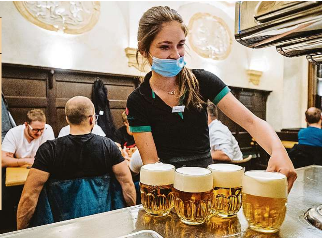
Lahvové se drží Zatímco cena točeného opět zvýší, cena piva v láhvi se dlouhodobě drží bez ohledu na inflaci.

Poznámka: jde o výběr z aktuálních nápojových lístků