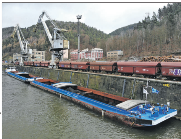
Loď s černým uhlím z Austrálie dorazila do přístavu v Děčíně v neděli. Tam uhlí přeložili na vlak, který je dopravil do Ostravy.

Až dosud dodávala největší množství koksovateľného uhlí ostravským hutníkům těžební společnost OKD. „Současná spotřeba uhlí z OKD už tvoří pouze asi 15 procent z celkového potřebného objemu. A po uzavření části dolů už OKD některé druhy uhlí nedodává, musíme je tedy dovážet nejen z Polska, ale také z USA, Kanady či Austrálie, a vytvářet si