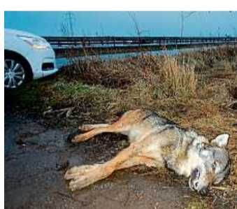
Na konci cesty Vlk z Bavorska.

Vlk k nám přišel z Bavorska pravděpodobně sám, předtím se pohyboval také v Rakousku. „Podle genetické analýzy jde zřejmě o zvíře, které pochází z alpské populace vlků. Byl to cestovatel, který si hledal teritorium a partnerku,“ řekl MF DNES Šafař, podle kterého se