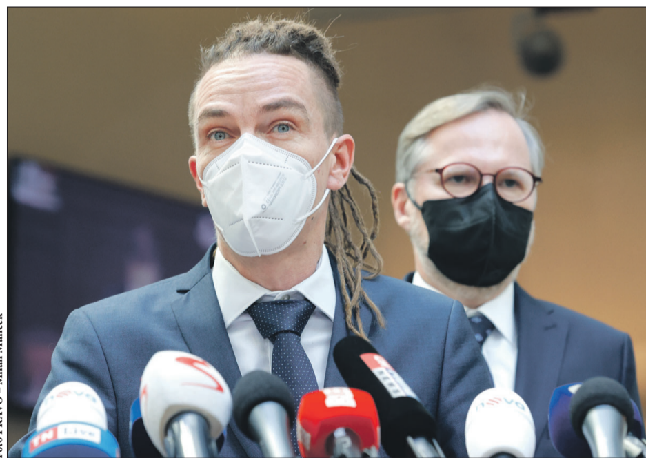
Vicepremiér Ivan Bartoš na včerejší tiskové konferenci, v pozadí premiér Petr Fiala.

Novela stavebního zákona pak bude předložena v polovi-