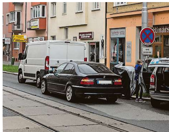
Bezohlednost Každoročně se vyskytnou stovky případů, kdy řidiči zbytečně zablokují veřejnou dopravu.

Na podzim by na půdě Sněmovny měla začít debata o novele zákona o provozu na pozemních komunikacích, která má rozsah trestných bodů zúžit ze současné sedmibodové škály na dva, čtyři a šest bodů. Návrh, na němž začali úředníci ministerstva dopravy pracovat už po začátku funkčního období předchozího vládního kabinetu, má za cíl zpřísnit nebezpečné přestupky, jako je alkohol za volantem a vjíždě-