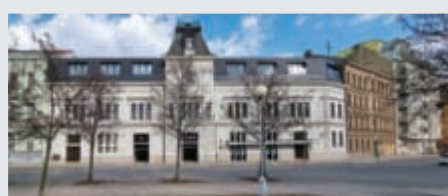
Investice roku 2021

Skupina e-Finance více jak 20 let investuje do nemovitosti v atraktivních lokalitách České republiky. Díky tomu disponuje stabilním portfoliem, zejména nájemních nemovitostí, v hodnotě přesahující 1 miliardu korun. Portfolio investic najdete na www.e-finance.eu .