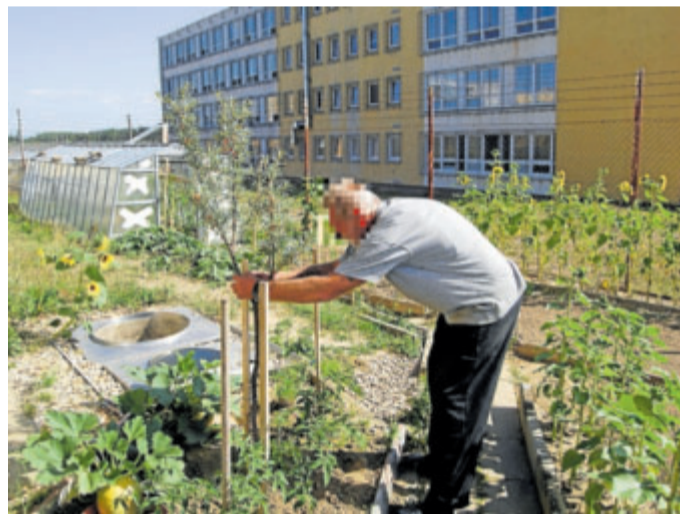
VĚZNICE praktikuje velmi starou metodu zahradní terapie, vězni se starají o záhony.

„Právě v těchto dnech vrcholí sezona okurek a rajčat, kterých se i letos podařilo hodně vypěstovat. Zralé plo-