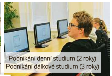
Podnikání denní studium (2 roky) Podnikání dálkové studium (3 roky)