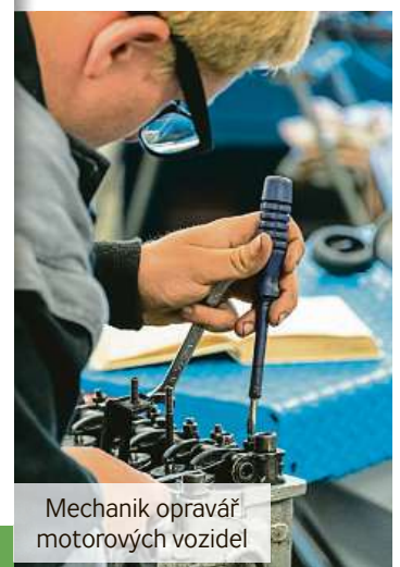
Mechanik opravář motorových vozidel