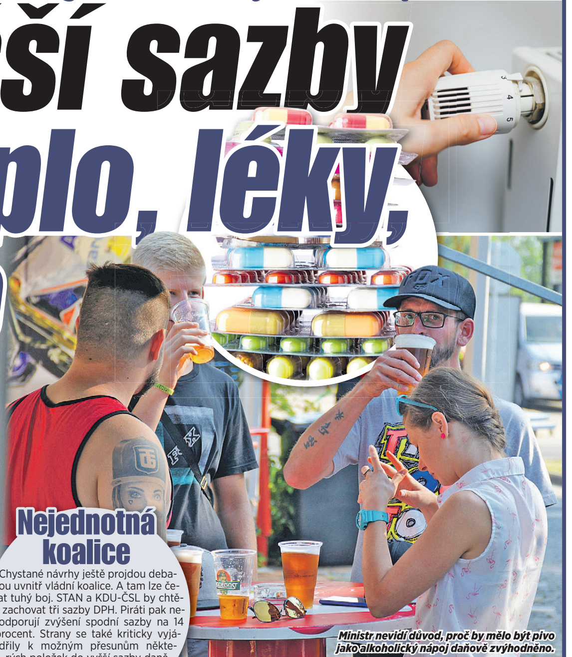
Ministr nevidí důvod, proč by mělo být pivo jako alkoholický nápoj daňově zvýhodněno.

ekonomka Danuše Nerudová (44). „Strach uznat chybu a napravit zrušení superhrubé mzdy (výpadek cca 92 miliard) kompenzujeme zvýšením DPH,“ uvedla na Twitteru. Podle ní změny v daních dopadnou na nízkopříjmové rodiny.