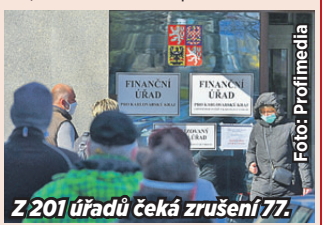
Z 201 úřadů čeká zrušení 77.

v praxi zajišťují především služby podatelů. Celý seznam je na webu mfcrcz. Místo zrušených úřadů pak stát nabídne lidem konzultační linky a v době podávání daňových příznáží rozšíří výjezdy do obcí. Zda bude rozhodnutí znamenat i propouštění, ministerstvo neupřesnilo.