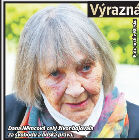
Dana Němcová celý život bojovala za svobodu a lidská práva.

PRAHA (dp) – Zemřela jedna z prvních signatářek Charty 77 a nejvýraznějších tváří disentu, Dana Němcová (†89). O jejím úmrtí včera informoval Výbor dobré vůle Nadace Olgy Havlové, již byla čestnou členkou.