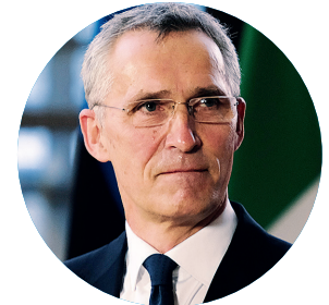
Jens Stoltenberg, generální tajemník NATO

Všichni členové NATO se shodli, že Ukrajina se stane členem Aliance, nyní je ale hlavním cílem vítězství Ukrajiny.