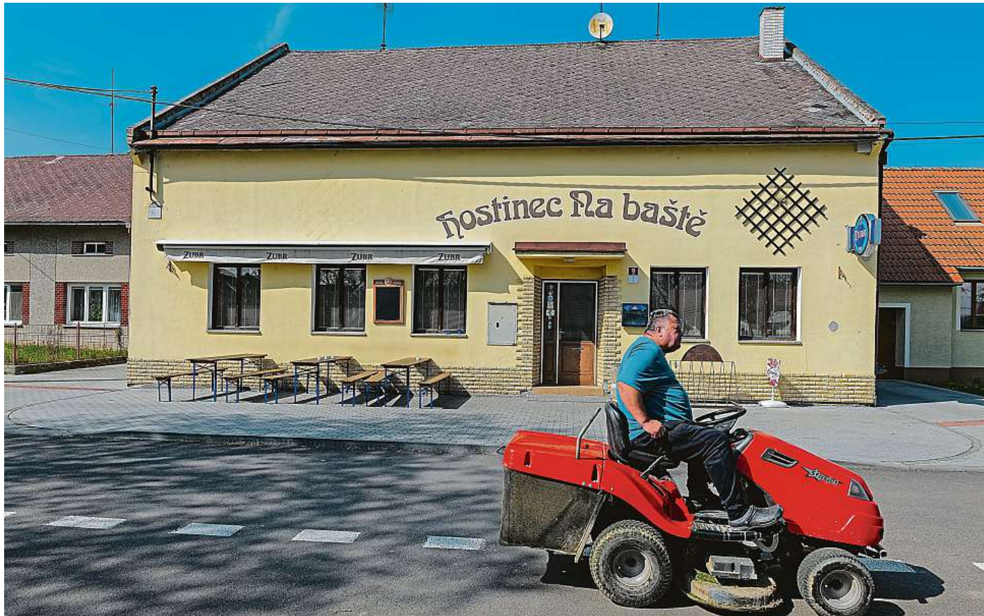
V ohrožení Hostinec Na Baště v přerovské místní části Lověšice trpí úbytkem hostů už od období pandemie koronaviru. Zvažované zdvojnásobení DPH na pivo by tak podle provozovatele podniku mohlo být příslovečným posledním hřebíčkem do rakve.

„Naše koalice chce potenciální úspory hledat primárně na straně státu a až poté v kapsách občanů. Tím se bude řídit politické rozhodování nad jednotlivými návrhy,“ uvedl minulý týden premiér Petr Fiala.