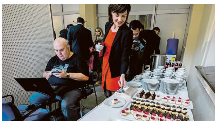
V zákulisí. Akce začínala „za pět minut dvanáct“.

Mimo jiné ale vláda hodlá škrtnout takzvané školkové, tedy slevu na dani za umístění dítěte do předškolního zařízení. Zdůvodňuje to tím, že tento benefit zpravidla uplatňují středně- a vysokopříjmové skupiny obyvatel s dostatečně vysokým základem daně, zatímco ti nízkopříjmoví tuto podporu pro nízký základ daně údajně využívají méně. Tříčlenná rodina může podle letošního propočtu LN přijít výpadkem školkového a slevy na nepracující manželku měsíčně až o 3,5 tisíce korun.