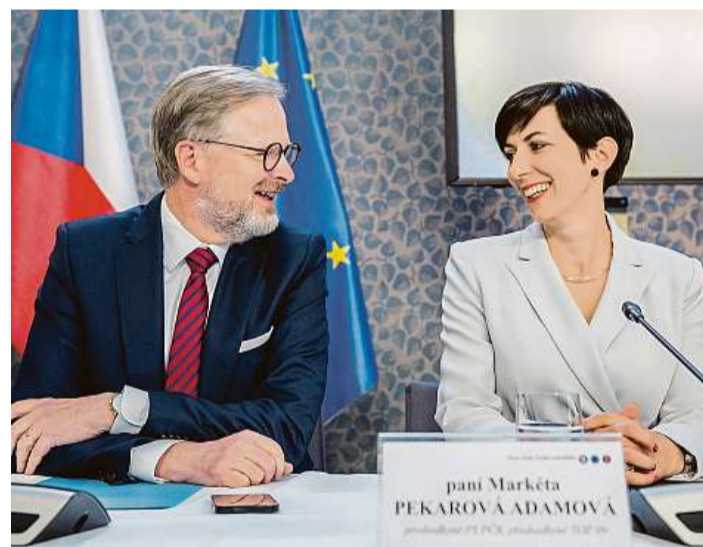
Prezentace. Petr Fiala s Markétou Pekarovou Adamovou.

jma pedagogických pracovníků,“ uvedlo ministerstvo financí. Kromě toho dostane každé ministerstvo za úkol ušetřit pět procent ze svých provozních výdajů.