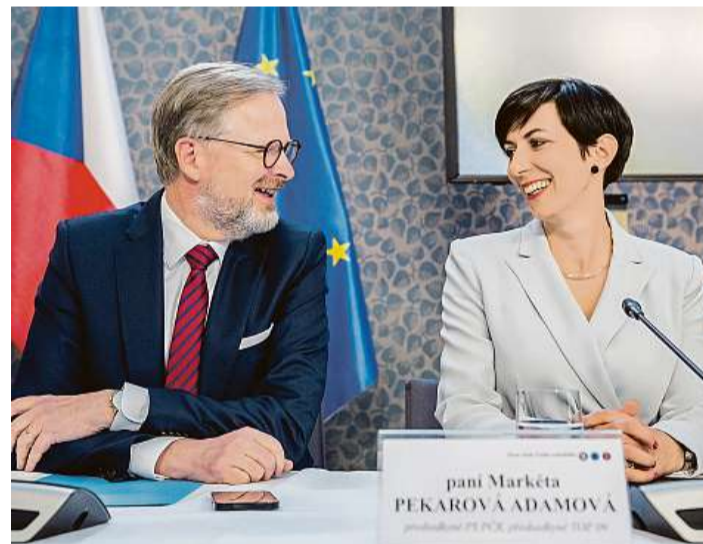
Prezentace. Petr Fiala s Markétou Pekarovou Adamovou.

jma pedagogických pracovníků,“ uvedlo ministerstvo financí. Kromě toho dostane každé ministerstvo za úkol ušetřit pět procent ze svých provozních výdajů.