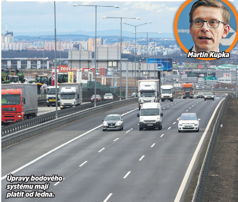
Úpravy bodového systému mají platit od ledna.

PRAHA (dak) – Nový bodový systém, masnější pokuty, řízení od sedmnácti a vyšší rychlost na vybraných částech dálnic. To jsou jen některé změny, kterým včera Sněmovna dala zelenou. Teď bude na řadě Se-