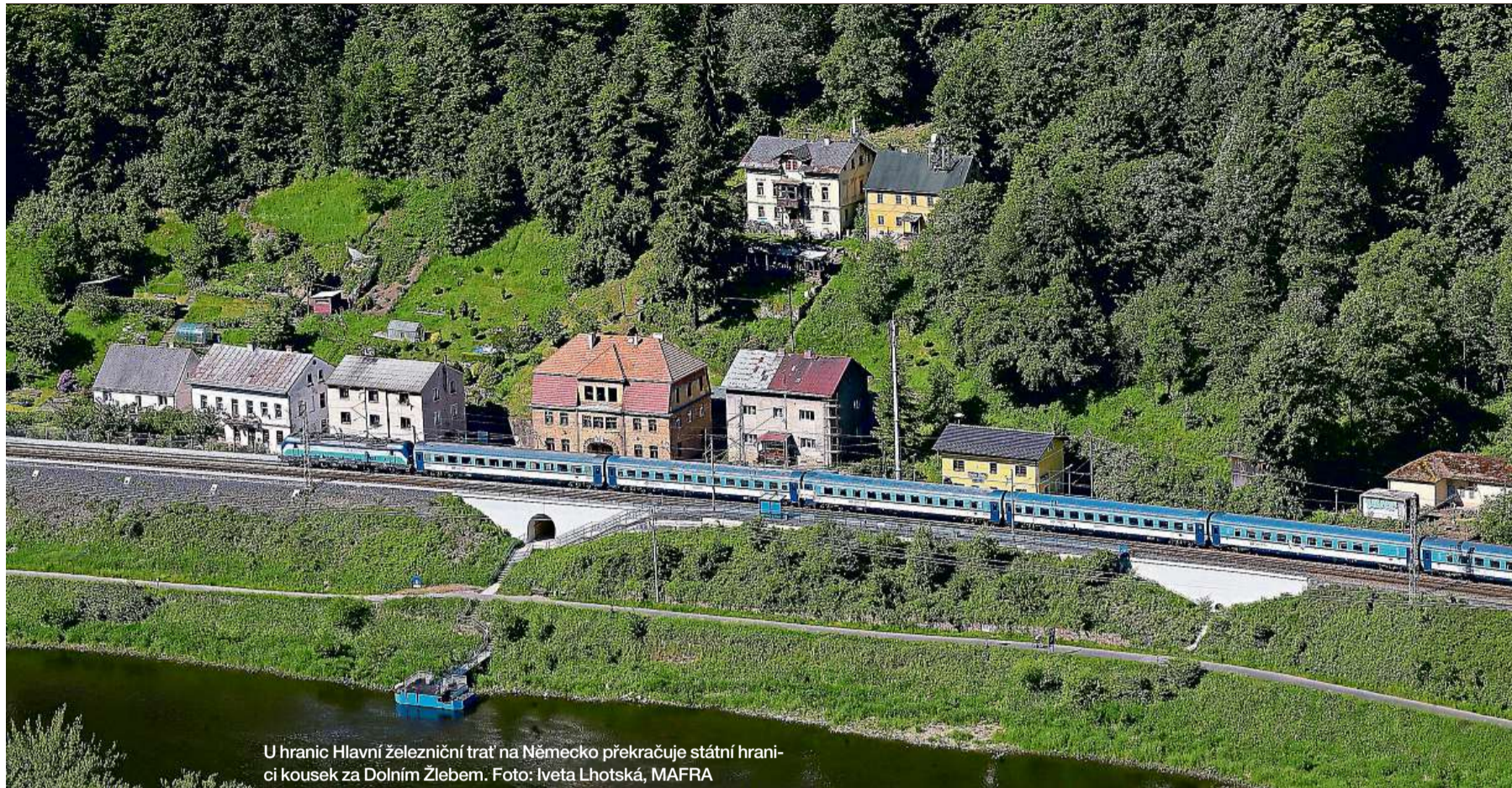
U hranic Hlavní železniční trať na Německo překračuje státní hranici kousek za Dolním Žlebem.

kých zařízení, které bude nutné opět předělávat.