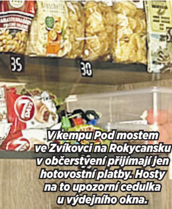
V kempu Pod mostem ve Zvíkovci na Rokycansku v občerstvení přijímají jen hotovostní platby. Hosty na to upozorní cedulka u výdejního okna.