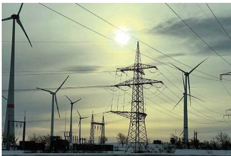
Zelená doktrína je pro Německo zátěží. Větrné parky, jako je tento v Krauschwitzu, jsou nákladné a stát už je nemůže dotovat.

30 procent exportu. Tato orientace se těžko mění i proto, že je to dlouhodobý stav a trvá již od vzniku samostatné České republiky v roce 1993. V krátkodobém horizontu nelze očekávat výrazný posun, někteří se ale dívají dál. „Diverzifikace exportu je s ohledem na stabilní růst ekonomiky zcela jistě žádoucí. Je to jedna z priorit Exportní strategie